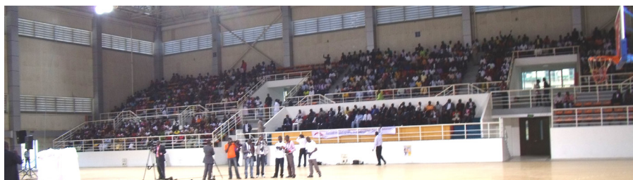
Na obrázku je vidět část velkého shromáždění ve stadionu v Luandě, Angola.