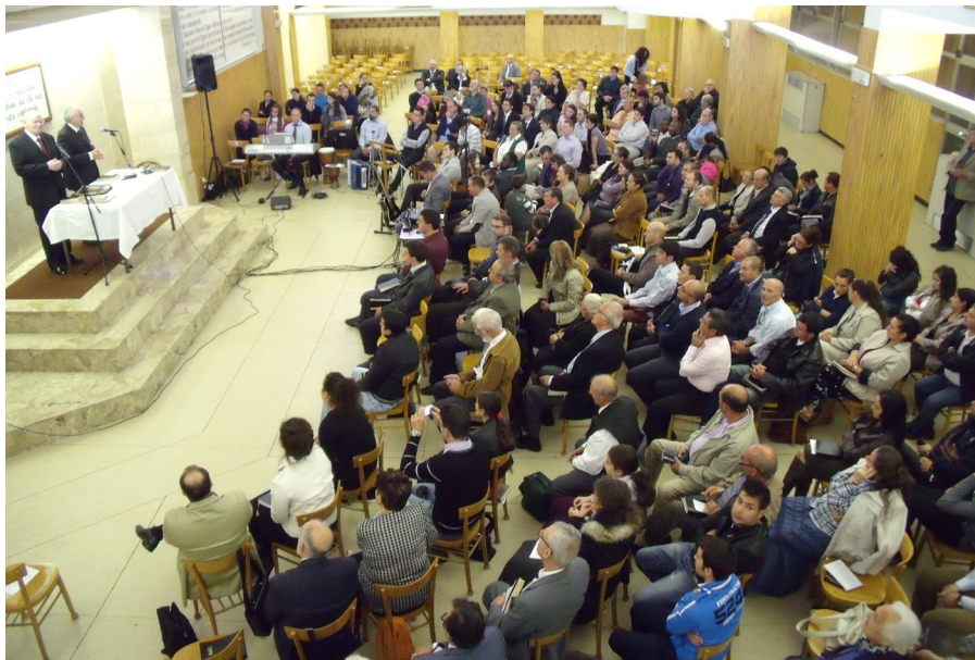
Shromáždění v Římě.